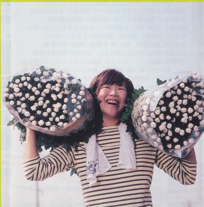
山口典利「農業一年生」視点賞